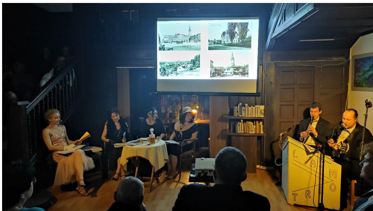
Obrázek 4 – 100 let Městské knihovny Frýdek-Místek