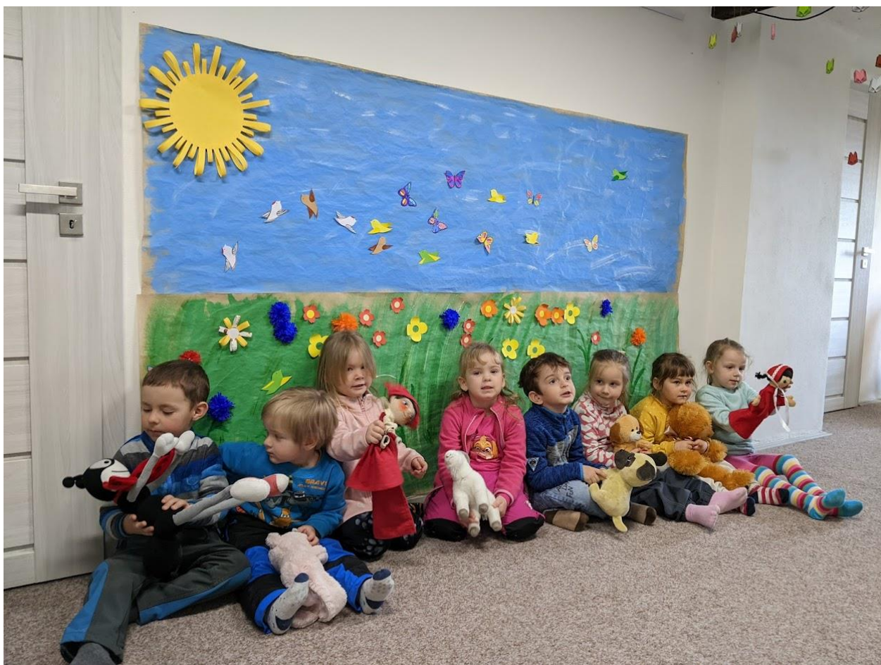
Obrázek 3 – Vrbno pod Pradědem – beseda pro MŠ Ve Svahu