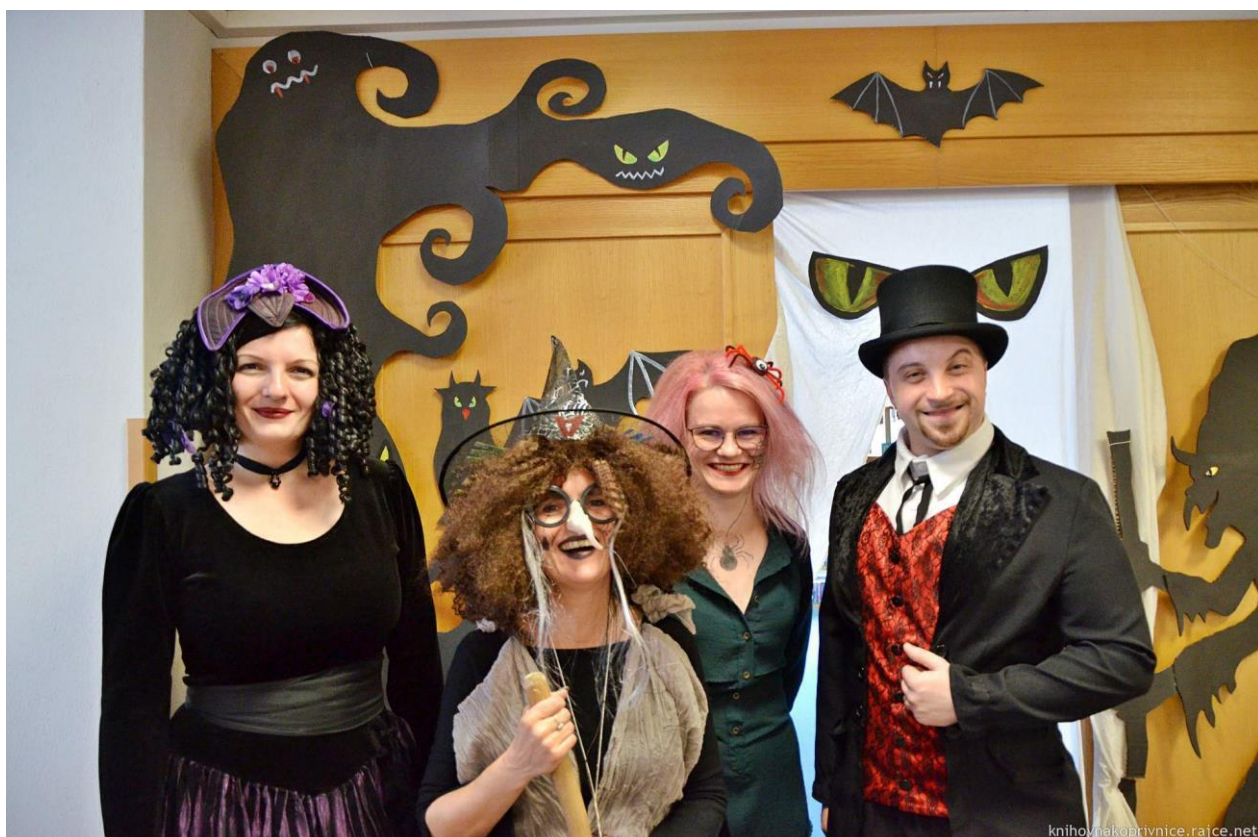
Obrázek 6 – MěK Kopřivnice – Halloween