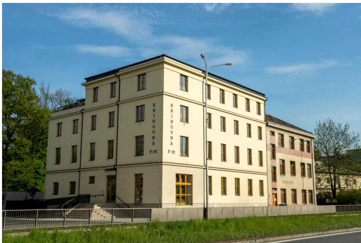
Obrázek 1 – MěK Frýdek-Místek – pobočka Místek po celkové rekonstrukci

Knihovna města Ostravy se soustředila v roce 2022 na otevření pobočky V Zálomu. Zrekonstruovaná pobočka skýtá nové, moderní prostředí s netradičními prvky, a interiérem, který navozuje pozitivní vztah k přírodě. Otevření proběhlo v červnu.