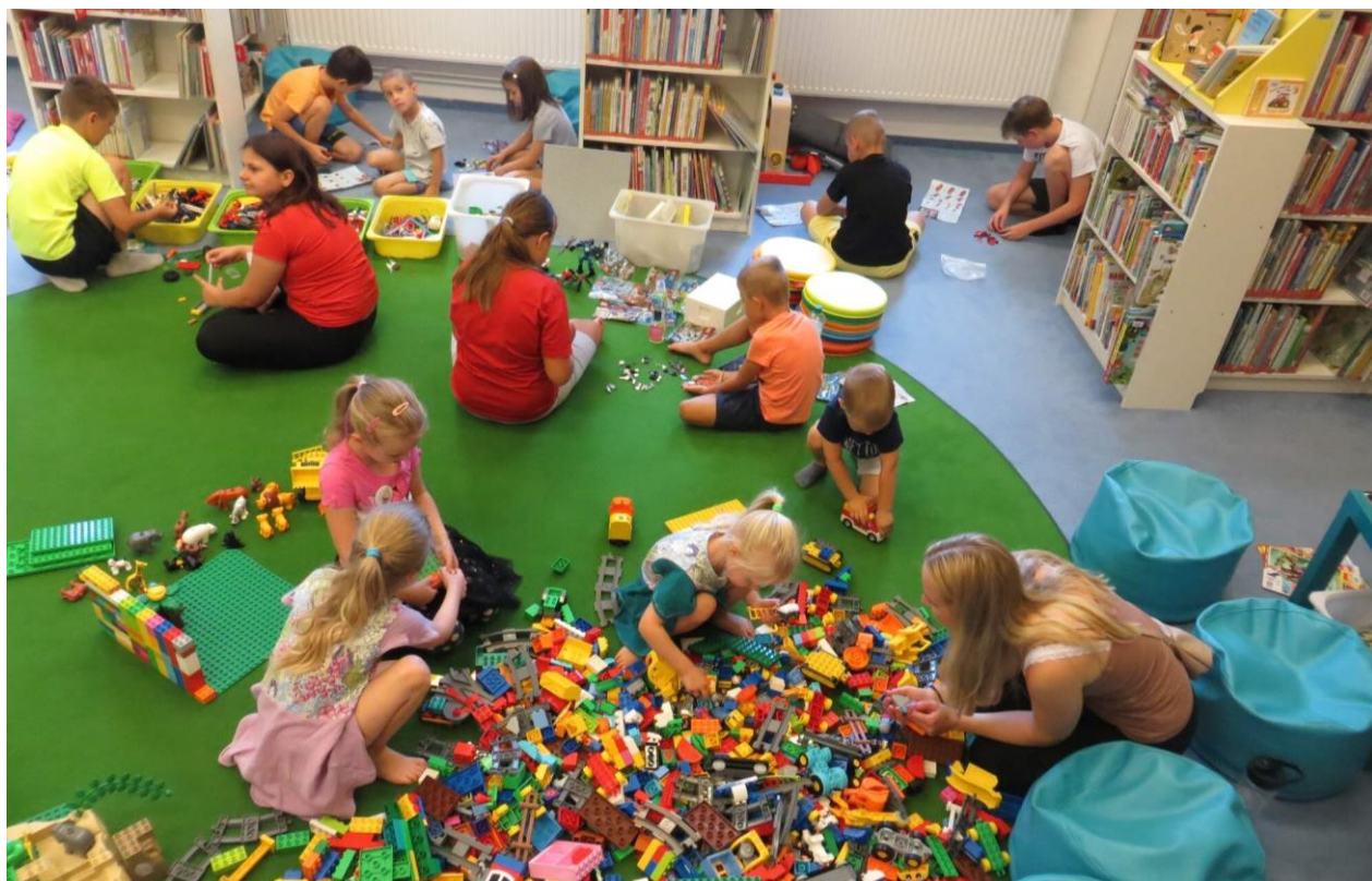
Obrázek 5 – MěK Petřvald (okr. Karviná) – Legodílna